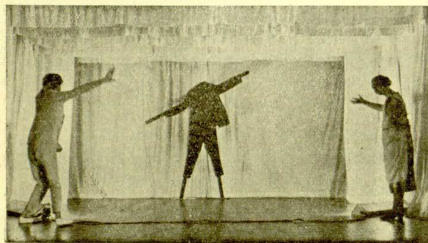
Hannes Meyer : Théâtre Co-op